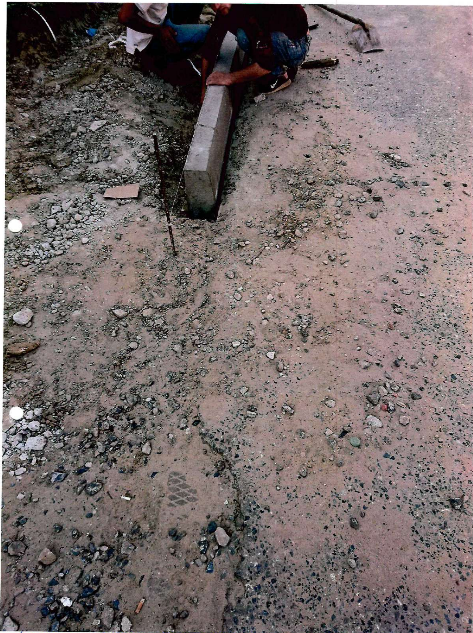
ремонт бортов (тротуара) по ул. Доблудная 04.06.18.