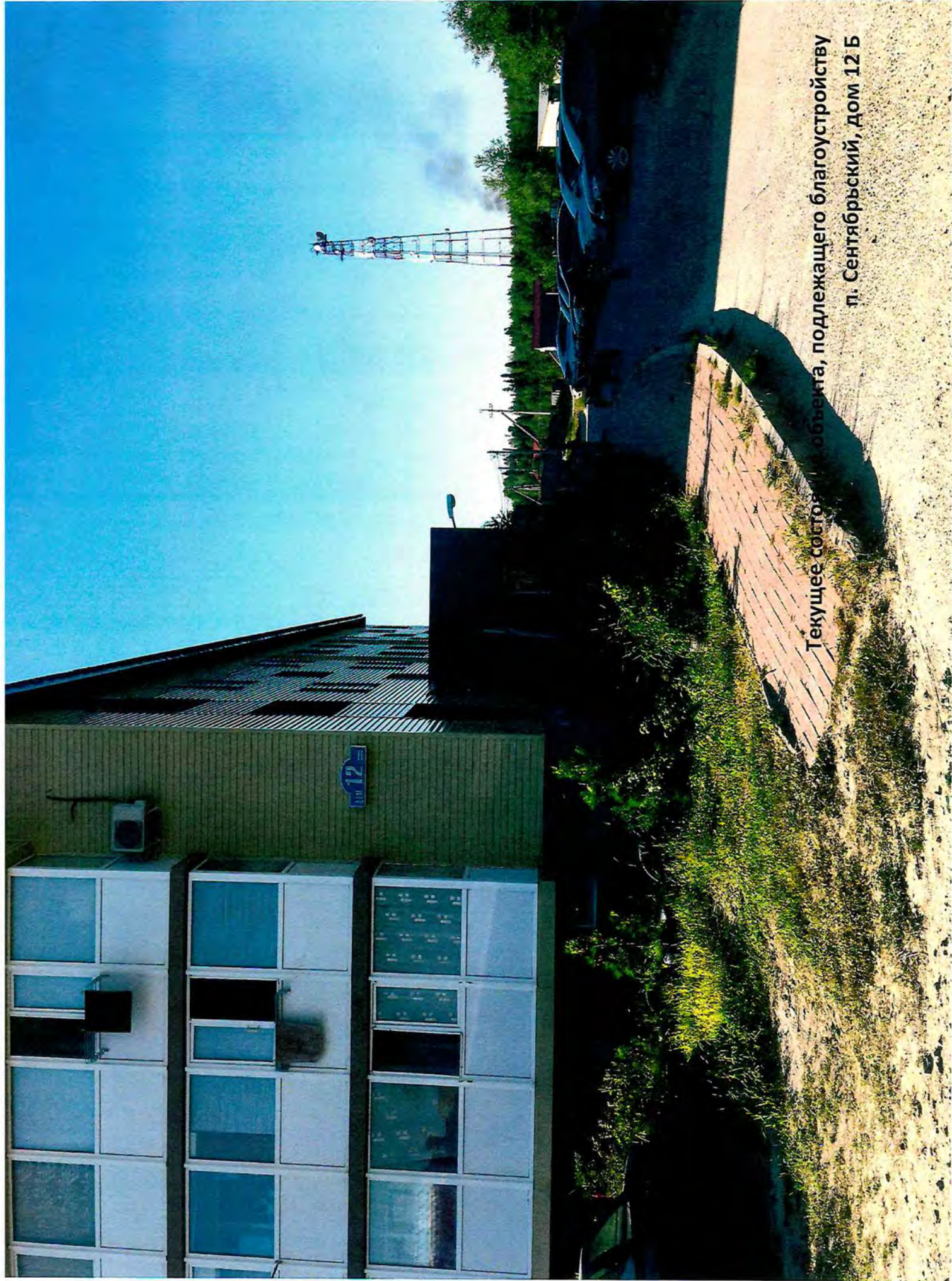
Текущее состояние объекта, подлежащего благоустройству п. Сентябрьский, дом 12 Б