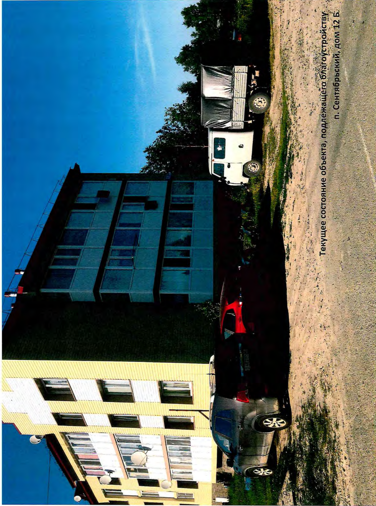
Текущее состояние объекта, подлежащего благоустройству п. Сентябрьский, дом 12 Б.