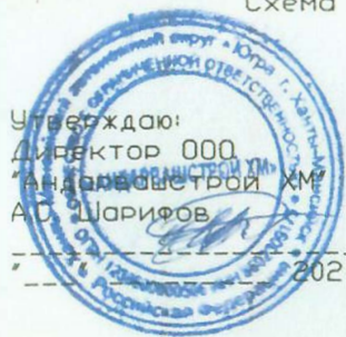
Схема организации дорожного движения и ограждения участка производства работ 000 "Андашстрой ХМ" ул. Школьная ПК 168+83 - ПК 206+00, вблизи образовательного учреждения в СП

Утверждаю: Директор 000 "Андашстрой ХМ" А.Д. Шарифов